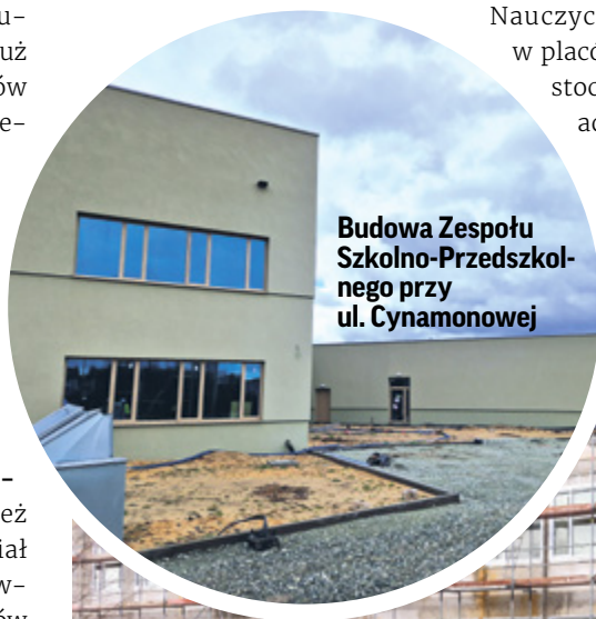
Budowa Zespołu Szkolno-Przedszkolnego przy ul. Cynamonowej