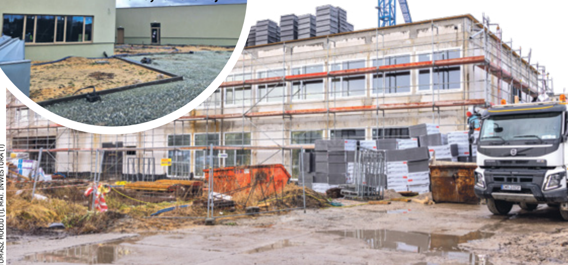
Przyjazny Zespół Szkolno-Przedszkolny przy ul. Białostockiej: stan budowy ze stycznia 2024

■ Więcej punktów z Nasz Wrocław i Nasz Wrocław MAX przy rekrutacji do podstawówek. Każde dziecko idące do klasy pierwszej szkoły podstawowej ma zagwarantowane miejsce w swojej szkole obwodowej. Jeśli jednak chcesz, by dostało się do szkoły pozaobwodowej, warto postarać się o dodatkowe punkty. 80 pkt. więcej dostanie kandydat, którego rodzic rozlicza podatki we Wrocławiu i jest zapisany do programu miejskiego Nasz Wrocław (kandydat do przedszkola 30 pkt.). A 90 pkt., który aktywuje w tym programie status Nasz Wrocław MAX, czyli oprócz rozliczenia podatku we Wrocławiu wykaże zameldowanie (kandydat do przedszkola 50 pkt.). Uwaga! Jeśli już jesteś użytkownikiem programu Nasz Wrocław i korzystasz z aplikacji w telefonie, podczas logowania, po trzykrotnym błędnym wpisaniu hasła, system zostanie zablokowany na 5 minut. W nowszych wersjach aplikacji Nasz Wrocław pojawi się odpowiedni komunikat, lecz w starszych już nie. Dlatego najlepiej zainstalować nową wersję aplikacji z www.play.google.com lub www.apple.com/pl/store . Nasz Wrocław to program zniżek i bezpłatnych wejść, a także tańsze bilety komunikacji miejskiej dla mieszkańców, którzy we Wrocławiu płacą podatki.